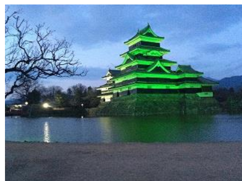
2018年世界緑内障週間に、グリーンにライトアップされた松本城

日本ではこの期間、日本緑内障学会が緑内障への関心喚起を目的として、これまで様々な啓発活動を行ってきました。2015年からは、各地のランドマーク施設を「緑内障」の「緑」にちなんでグリーンにライトアップする「ライトアップ in グリーン運動」を開始しました。2015年に全国5カ所のライトアップでスタートした本活動も、緑内障啓発効果への期待の高まりとともに、2016年は全国20カ所、2017年には全国44カ所、2018年には85カ所と、運動の輪は広がり、2019年は108カ所の施設がグリーンにライトアップされることとなりました。また、海外でも実施されるようになっていきます。