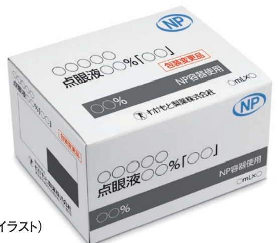
個装箱(イメージイラスト)