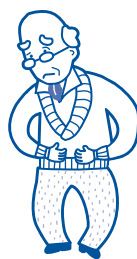
腸の老化からくる便秘・軟便が気になる方